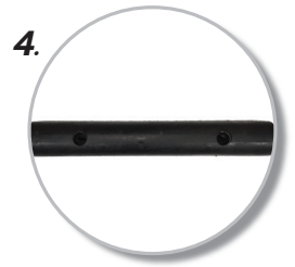
4. เหมาะสำหรับติดตั้ง ในลานจอดรถหรือโกดังเก็บสินค้า