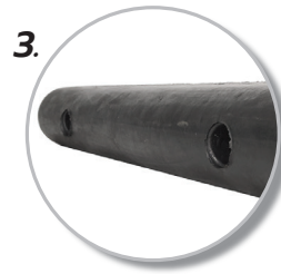
3. ติดตั้งโดยใช้พุก 2 ตัว